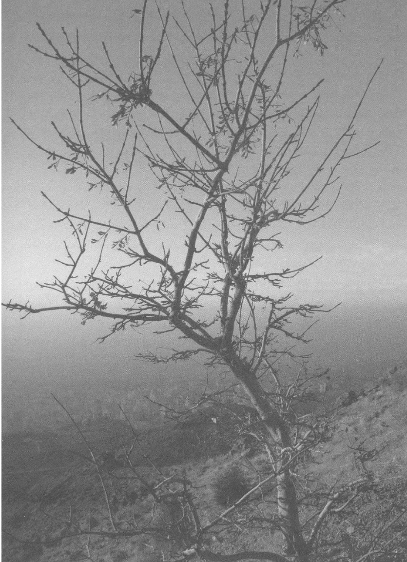
تک درختی منتظر در ارتفاعات البرز، تهران؛ بهزادفر، ۱۳۸۹/۰۹/۲۰

آرزوی پایداری در دامنه توجال، که پس زمینهای آن را تهران غرق در آلودگی شکل داده است.